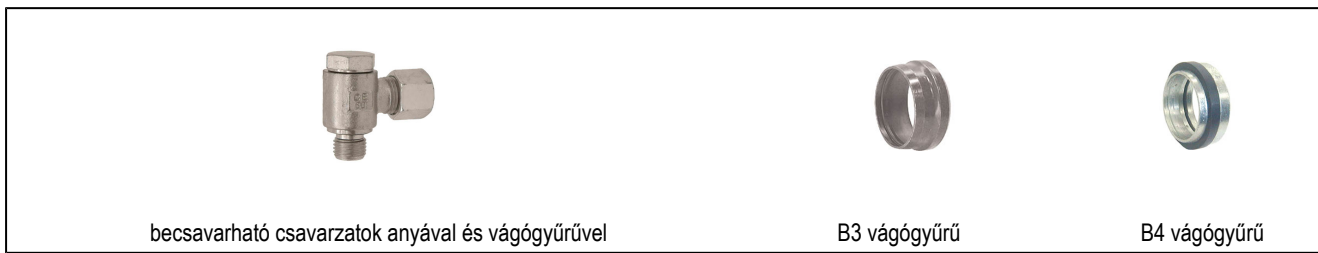
becsavarható csavarzatok anyával és vágógyűrűvel