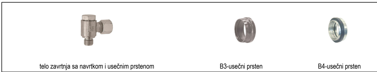
telo zavrtnja sa navrtkom i usečnim prstenom