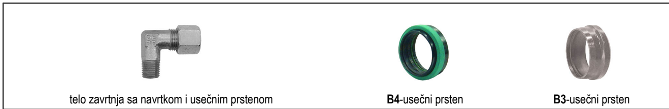
telo zavrtnja sa navrtkom i usečnim prstenom