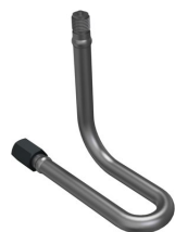
Forma a U