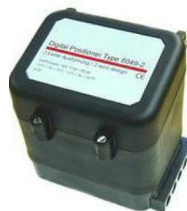
poziționar digital 8049