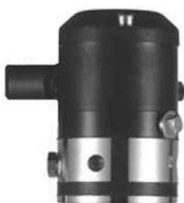
regulator analog de poziție 8047